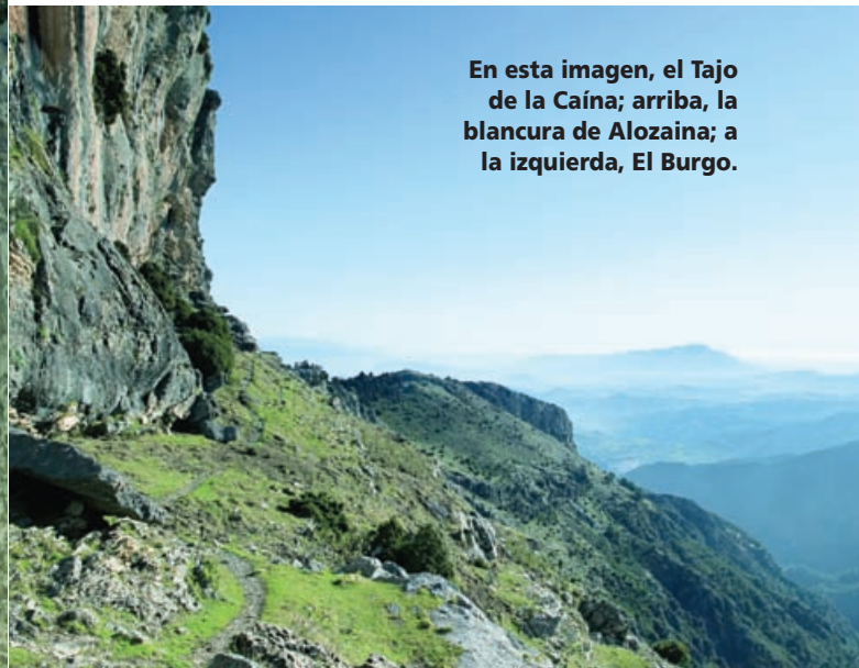
En esta imagen, el Tajo de la Caína; arriba, la blancura de Alozaina; a la izquierda, El Burgo.

entorno natural. Estos itinerarios ayudarán a los turistas a conocer las particularidades del urbanismo rural y a no perder detalle de los sitios turísticos más destacados. Monumentos, cascos históricos de interés, los rincones más típicos y llenos de tradición o el patrimonio etnográfico son algunas de las propuestas de estos paseos que no debes perderte.