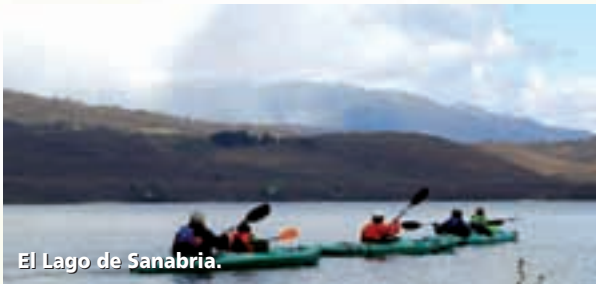
El Lago de Sanabria.