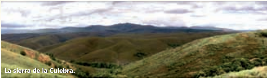
La sierra de la Culebra.