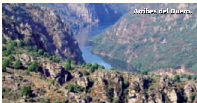
Arribes del Duero.

Flora. En este valle encajado, sin viento ni heladas, con cierta humedad y con mucho sol, vive una rica comunidad vegetal con gran y sorprendente abundancia de especies mediterráneas. Florecen viñas, olivos, madroños o enebros, e incluso algún naranjo, y entre la vegetación baja hay jaras, espliego, lavanda... Resulta singular el alcornoque de Fornillos de