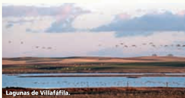
Lagunas de Villafáfila.